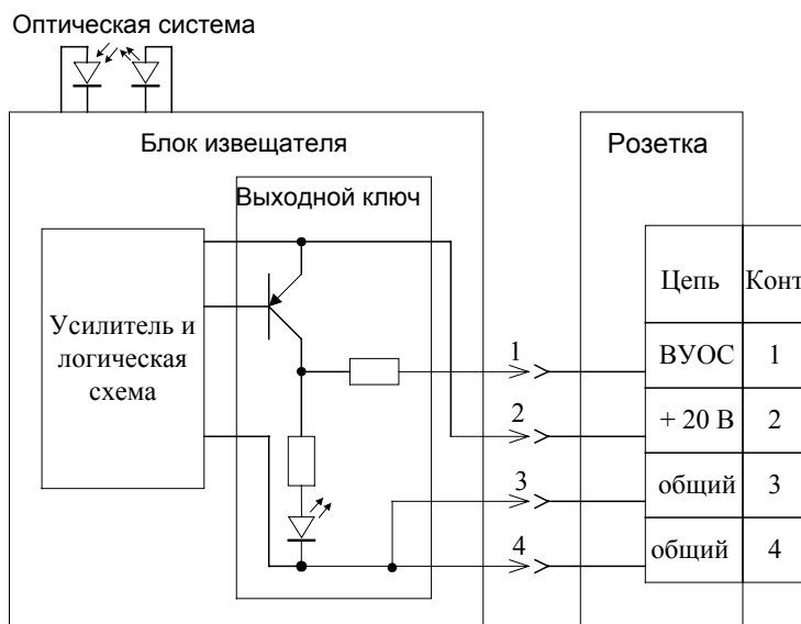
Рис. 6 1

Ток, протекающий через открытый выходной ключ, обеспечивает постоянное свечение оптического индикатора извещателя, а также выносного устройства оптической сигнализации (ВУОС), подключаемого к контактам 1 и 4 розетки.