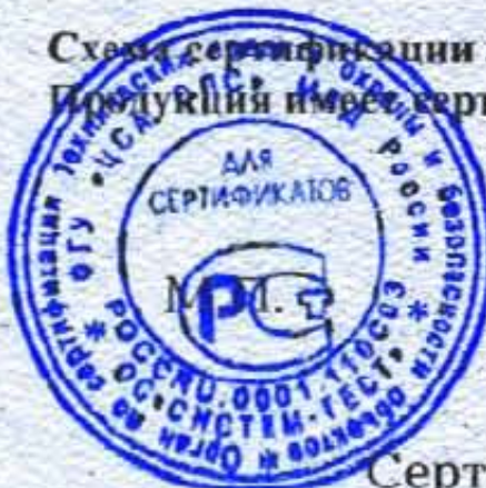
Схема сертификации №3. Инспекционный контроль проводится один раз в год. Продукция имеет сертификат пожарной безопасности № ССПБ.RU.ОП066.В00983 от 02.04.2009.